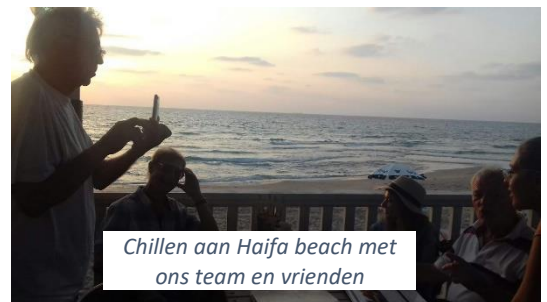
Chillen aan Haifa beach met ons team en vrienden