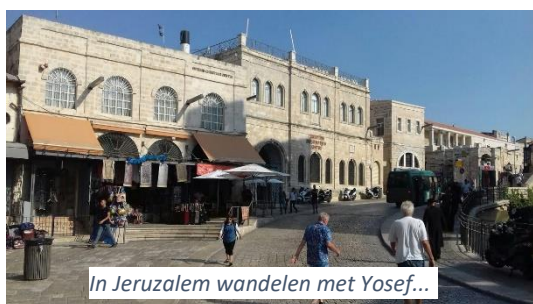
In Jeruzalem wandelen met Yosef...